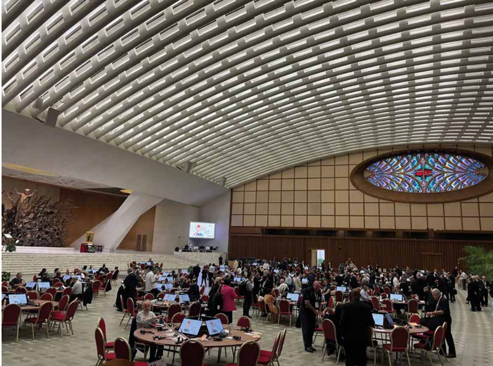
Synode-deelnemers aan ronde tafels zonder rang of stand.

heten. Dat hebben ze allemaal gedaan, op één na: de conservatieve Duitse kardinaal Gerhard Ludwig Müller, die enkele jaren geleden door paus Franciscus is ontslagen als prefect van de Congregatie voor de Geloofsleer. Hij is bijna twee meter lang, dus hij viel wel op als ‘eenzaam Roodkapje’ tussen de deelnemers. Dat de paus hem toch voor de synode had uitgenodigd, vind ik trouwens groots: ook het conservatieve geluid mag gehoord worden. De conservatieve flank, die nog altijd sterk is in de rooms-katholieke kerk, kan nu niet na afloop gaan klagen: ‘naar ons wordt niet geluisterd.’