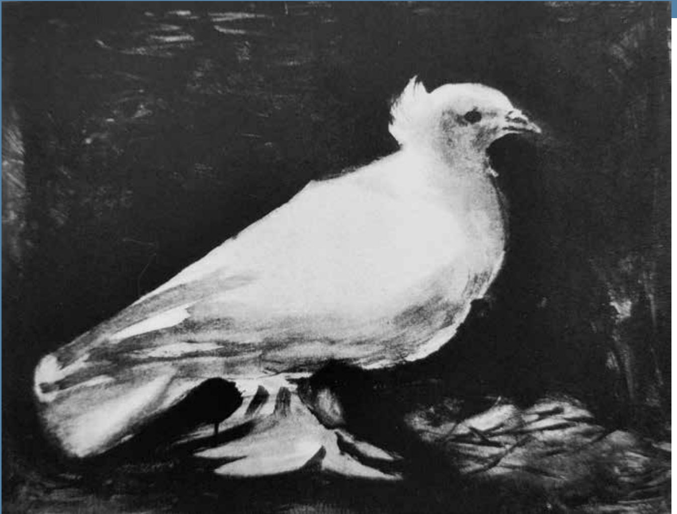
Picasso, De duif, 1949 (lithografie 54,5 x 70 cm)